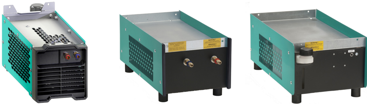
Abb. C - 1 WK 210 / WK 300 / WK 325